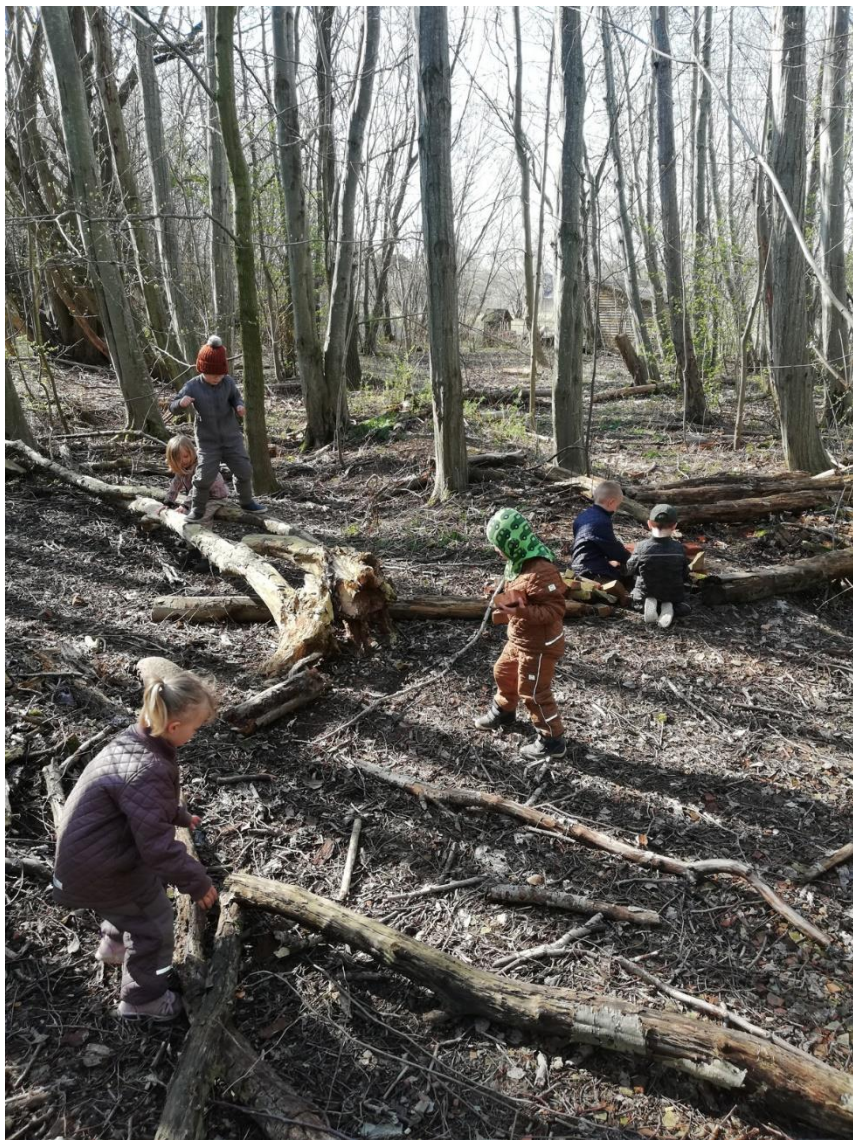
Et billedokumentation en forårsdag i april 2021.